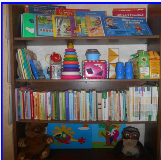
Стеллаж с методическими пособиями и литературой