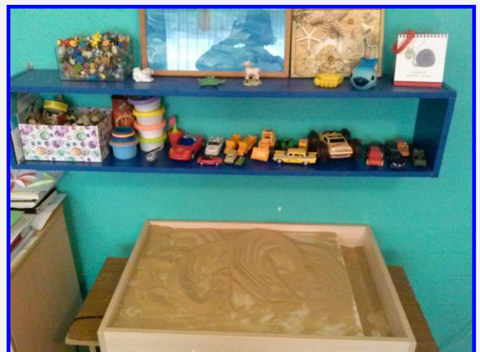
Световой стол с игровым оборудованием