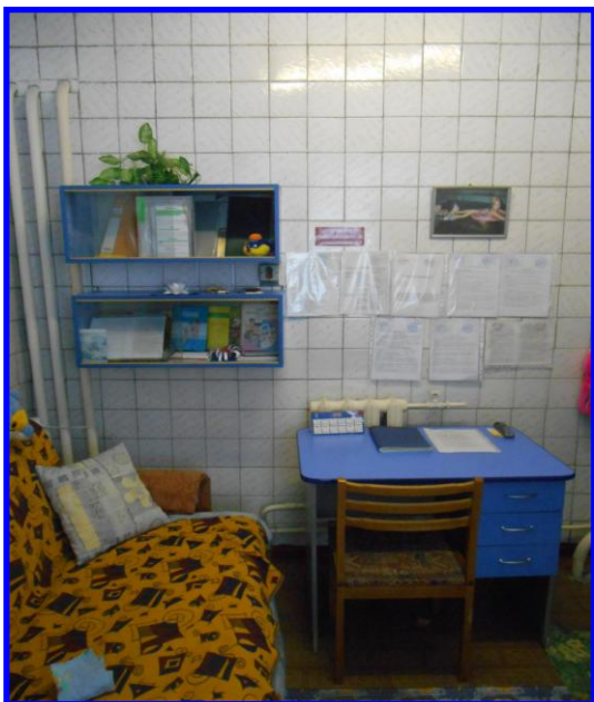
методический уголок инструктора по плаванию